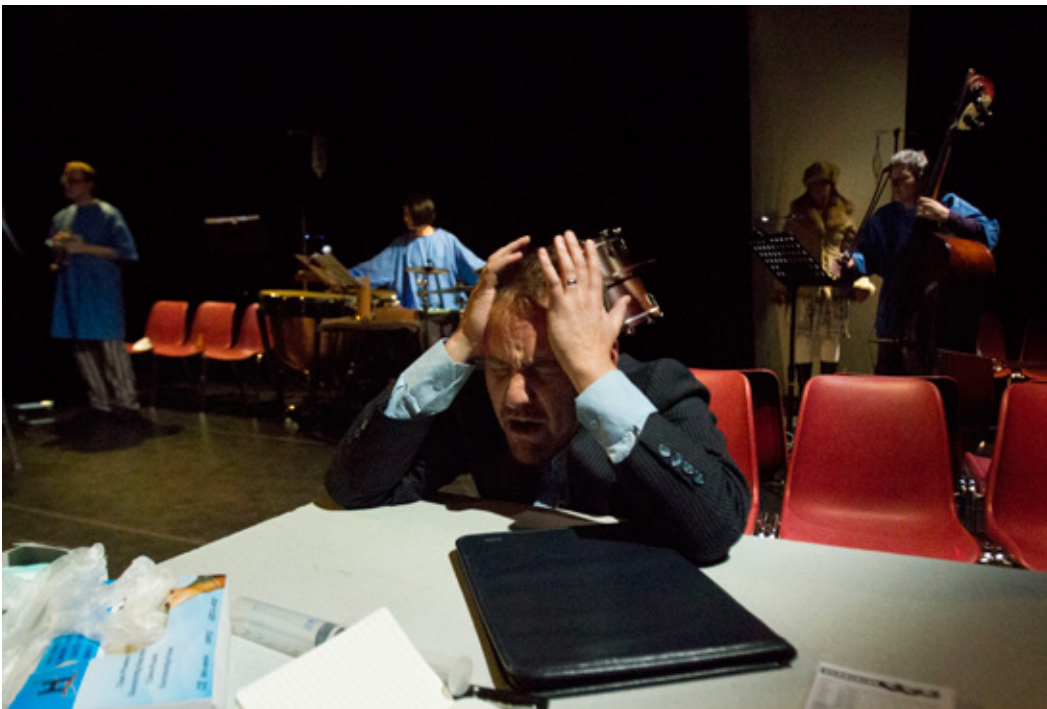
'Black Perfume' 2013